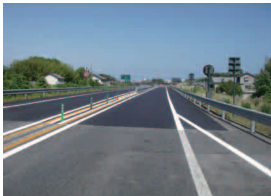
● 西日本高速道路株式会社 四国支社 高知自動車道 新宮～須崎東間舗装補修工事 【愛媛県・高知県】