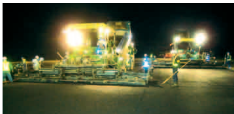
中標津空港整備事業滑走路改良工事での施工状況

製造時の省エネルギーやCO 2 排出抑制に加えて、寒冷期における高品質な施工や、交通開放までの時間短縮効果による交通渋滞の緩和などにも効果が得られています。