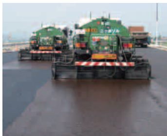
クリアゾルの散布状況

夏季など路面温度が高い時に、タックコート用乳剤やゴム入りアスファルト乳剤がダンプトラックやアスファルトフィニッシャーなどの施工車両のタイヤに付着し、隣接車線等を汚す場合があります。