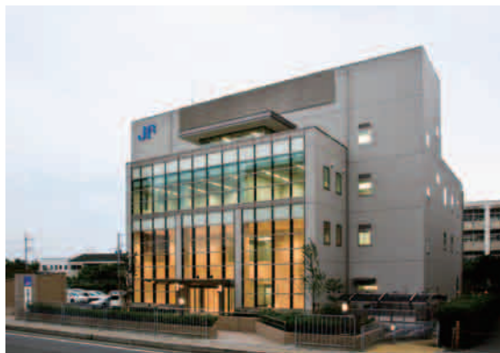
● 兵庫県漁業協同組合連合会 兵庫県水産会館新築工事 【兵庫県】