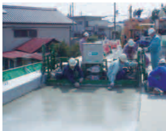
低騒音コンパクトフィニッシャーを使用した民家に近接する橋梁での施工風景

打設には、新たに NIPPO が開発した、大型クレーンや走行用レールが不要な『 低騒音コンパクトフィニッシャー 』を使用し、コンクリートには耐久性に優れた『 膨張材入り鋼繊維補強超速硬コンクリート（膨張 JetSFRC） 』を用い、短い規制時間でスマートに増厚補強（オーバーレイ）を行います。