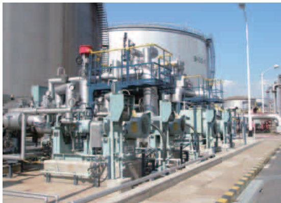
● 新日本石油精製株式会社 SDAオフサイト設備設置工事 【岡山県】