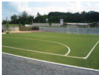
フットサル場の施工例

そこで、ロングパイル人工芝の基盤に用いる緩衝層として低反発弾性舗装「LREペープ」を開発しました。(財)日本サッカー協会から「JFA ロングパイル人工芝製品検査完了証」の認証を受けています。