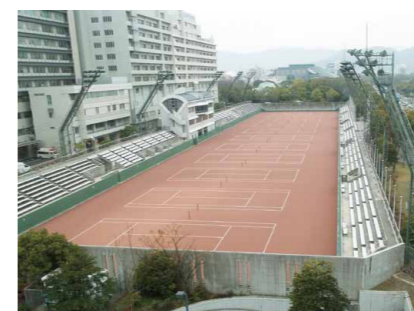
広島市中央庭球場

広島市より発注を受けた庭球場改修工事の施工場所は、広島市の中心部にあり、広島市民病院が隣接しているため、施工時には特に騒音と振動に注意しました。騒音は80db・振動は60dbを基準とし、使用機械の選定および施工速度に十分注意して施工を行いました。