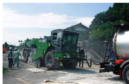
スタビライザの一例

URL http://www.nippo-c.co.jp/machidukuri/machine/index.html