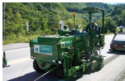
ランブルストリップス用機械