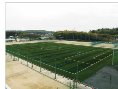
四日市中央工業高等学校グラウンド

四日市中央工業高等学校は、サッカー部が全国的にも強豪校であることから、三重県の強化指定運動部になり、県立高校として初となる人工芝コートに整備されました。当社の技術力を活用し、JFA公認コートと同等の精度に仕上げることができ、発注者である三重県より好評価を得ました。