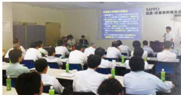
改良・改善事例報告会の様子

「確かなものづくり」を具体化するために、現場における改良点・改善点を考える習慣を身につけるとともに、生産性向上を図ることを目的に、2013年8月に開催しました。全国の応募から選定された20編が本社にて報告されました。