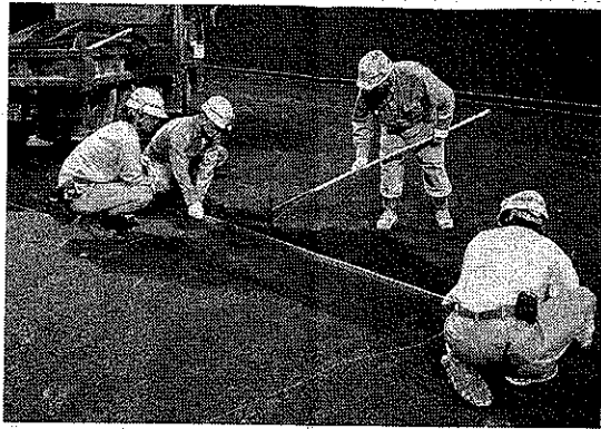
センターコートの不陸調整

センターコート（1158平方メートル）については、既存のサーフェイスをはがした後、路盤となる密粒度アスファルトコンクリートによる舗装作業を行った上で、デコターフを施工し、全面的に張り替えた。デコターフは、10