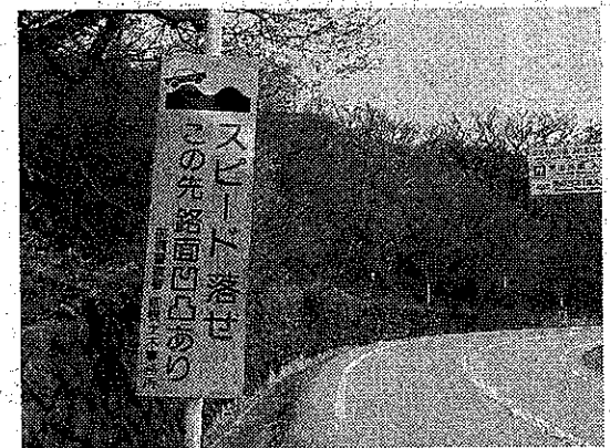
注意喚起の標識設置も提案