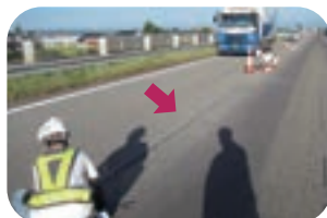
従来の通り出し作業：施工する範囲を測定し、チョークの付着した糸でマーキングしていく。作業者が屈んだ姿勢を取る必要があるなど身体への負担も大きい。