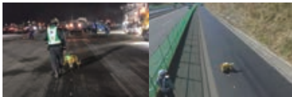
伊丹空港（左）や新東名高速道路（右）の施工現場で試用・検証中の様子

これまで10カ所以上の現場にて試用・検証を行った結果、従来方法と比較すると、作業人員、作業時間ともに8割程度の削減が確認されました。中には、作業効率比較で10倍以上も向上した現場もありました。