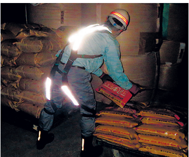
夜間の視認性が向上

舗装作業時は中腰でのレッキ作業やスコップ作業のほか、しゃがみこんでのマーキング作業、建設機械の運転などさまざまな作業姿勢を取っており、腰部への負担が大きかった。14年度から労働者の疲労軽減対策に取り組んでいたNIPPOは、舗装工や製品製造、品質管理の試験業務などに携わる約50人でさまざまな疲労軽減スーツの試着評価を実施。その結果、着用感や着脱の手間が少なく、疲労軽減機能のあるラクニエの採用を決めた。